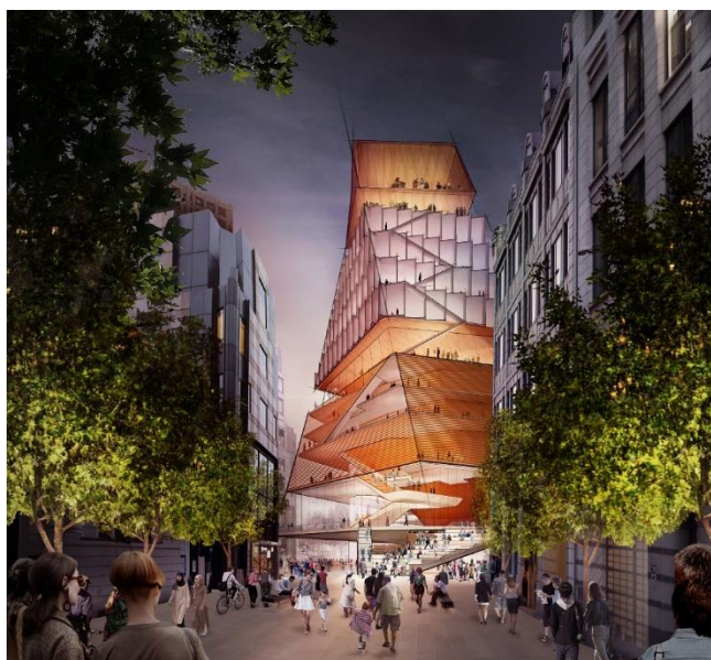
Vítězný návrh nové londýnské filharmonie od Liz Diller

„Potenciál Vltavské je z hlediska Prahy naprosto hybatelný, naprosto klíčový. V rozšíření centra do těchto míst je možné hledat zlatý důl, už naši předci začali tuhle intervenci objevovat. Za první republiky tu postavili budovu dopravních podniků, jeden z nejskvostnějších paláců. Ta budova předznamenávala, že by měla být levá strana Vltavy intenzivně využita pro významné veřejné budovy,“ domnívá se Josef Pleskot. Celý rozhovor o filharmonii s respektovaným architektem je dostupný na stránkách SAR www.arch-rozvoj.cz .